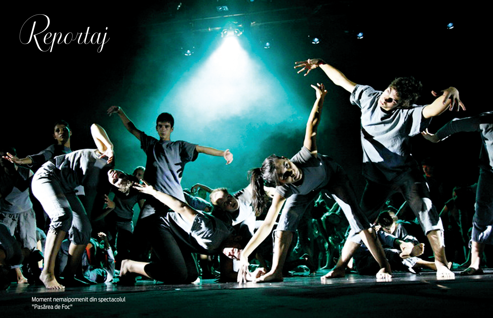
Moment nemaipomenit din spectacolul "Pasărea de Foc"